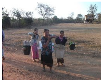
天秤棒で水を運ぶ女性たち