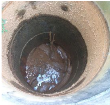
泥酔化している井戸の中