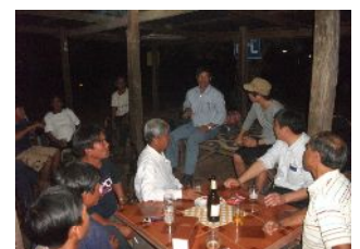
村人とこれまでを振り返る