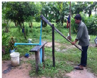
ゴム園にある新たな水源