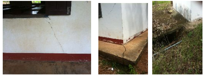
教室の壁(左) 基礎部分のひび割れ(中央) トイレの処理タンク(右)

一方で、数年前に作った井戸が生活用水として整備することにしたが、ゴムの木の水やり掘られた井戸から偶然『透明で無味無臭の水』が出たということから、現在ではそれを飲料水として利用している、こうした現状を踏まえ、我々は持続可能な村の再生を考え実行に移そうとしています。ゴムの樹液を利用した企業作りもその一つです。