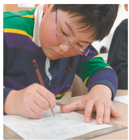
筆順に従って書くとき書きやすい！

流れて手がどうしても揺れるんだね。その揺れが伝わって字が揺れるんだ。ゆっくり書くとその揺れが多く伝わって震えの多い字になってしまいう。震えの少ない字の方がきれい。早く書けば、震えが少なくなるんだ。早く書くと言っても乱暴に書いてはいけないよ。 蒼 きれいな字だということがありますか？ 江川 「書は人なり」という言葉があります。書いた文字がその人の人柄や性格を表すという意味です。そうすると、個性的な字もいろいろ、やはりきれいな整った字が書けるといいですね。 江川 早く書くこと。書かれた字を顕微鏡で見ると震えているのが分かるよ。血液の