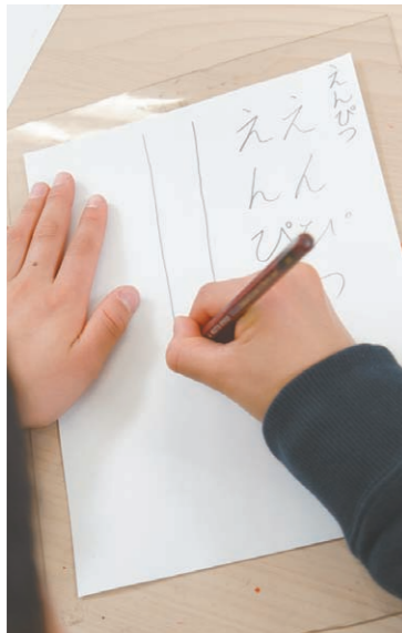
上手な字を書くための練習。書き出しはいったん止めて「用意」、そして「スタート」で一気に入線を引きます

「新潟日報ことば新聞 月刊ふむふむ」は原則毎月第2火曜日に発行します。みなさんがいま知りたいと思っていること、疑問に思っていることに、ていねいに答え、納得してもらえような新聞を目指します。