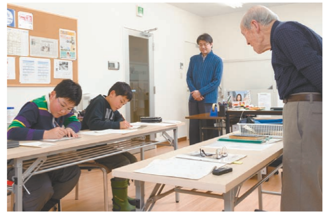
いつも書いている字も上手に書こうとすると緊張しました