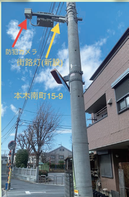
防犯カメラ 街路灯(新設)