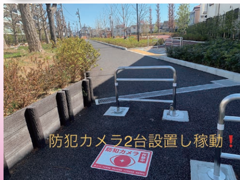
防犯カメラ2台設置し稼働！