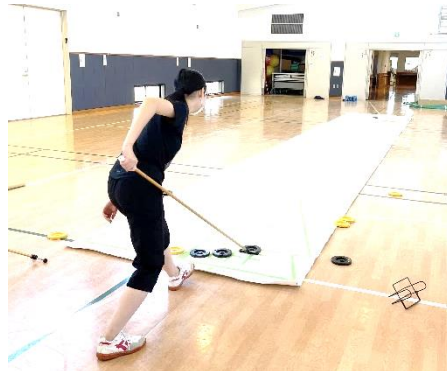
シャッフルボード