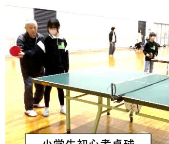
小学生初心者卓球

スポーツを通じた健康づくり・体力づくりの場を設けるため、引き続き活動を続けていきます。サークル所属の方は昨年度と同様に取りまとめていただき、各々に更新・入会の手続きを行ってください。