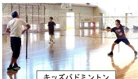
キッズバドミントン

「キッズスポーツ(1年~4年対象)」「キッズサッカー(3年~6年対象)」継続・新規申し込み受付を会員募集と同時に開始します。また「キッズバドミントン」新規申し込み受付を3月23日(日)9時よりクラブ事務所にて先着順で行います。いずれのスクールも定員になり次第、募集を終了いたしますので、新規申し込み希望者はお早めに申し込みを行ってください。