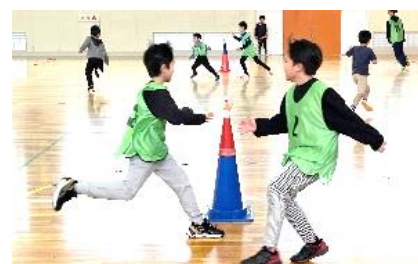
キッズスポーツ (スポーツ鬼ごっこ)

クラブは10月からキッズ・スポーツ後期の活動を開始しました。このスクールは会員限定の[半期]1,000円で申込者が参加できる小学1~4年生向け事業ですが、テニスやバドミントンなど月替わりで様々な種目が楽しめます。体験者も募集中です。