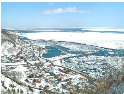
羅臼町望郷台より

TEL: 011-807-6811 FAX: 011-807-6800 E-mail: t-sasaki@econixe.co.jp