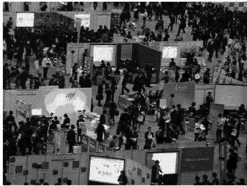
学生との接点づくりが課題に（3月、都内で開かれた企業説明会）

「5月中旬までに採用予定数の6〜7割の学生から内定承諾を得た」。サイバーエージェントの担当者は安堵の表情を浮かべる。同社は今年から、社員が就活生のもとに出向いて説明会と面接を併せて実施する採用活動を始めた。面接を受けたいという学生から要望があれば、全国47都道府県のどこにでも出向いて11カ